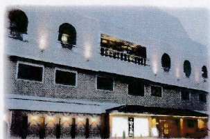
Leo Plaza Hotel